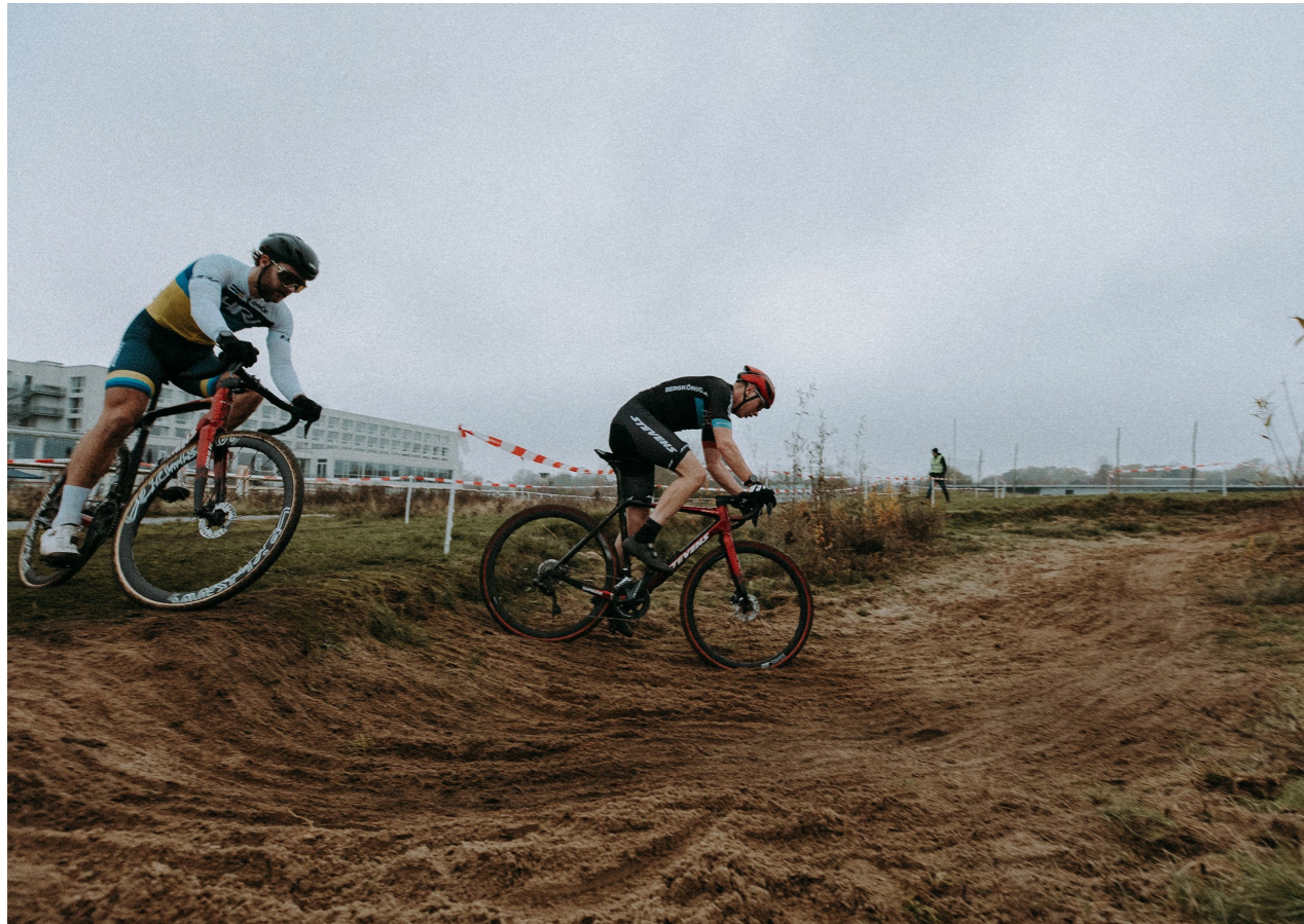
Cyclocross, RadRennGemeinschaft Bremen