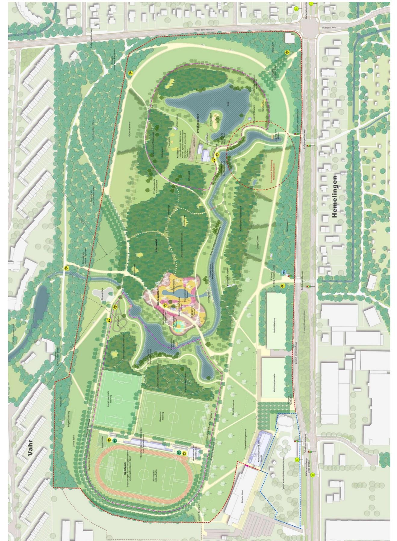
Räumliche Einordnung Rennbahnareal