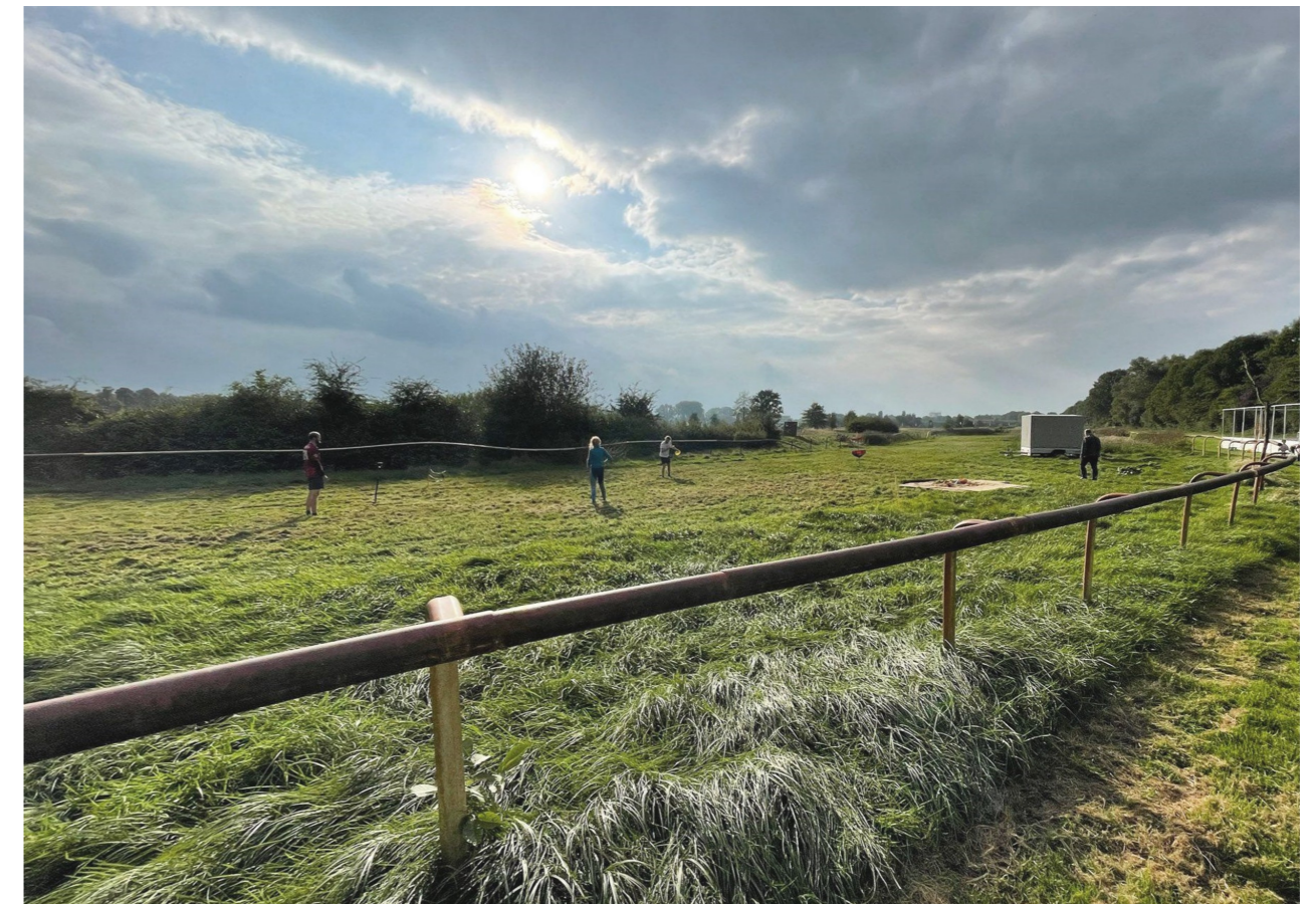
Die Grüne Bahn