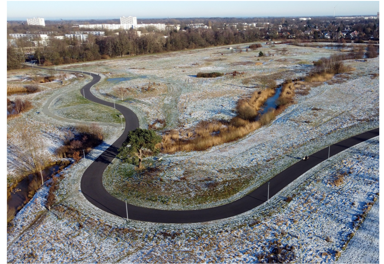
Fuß- und Radwegeverbindung