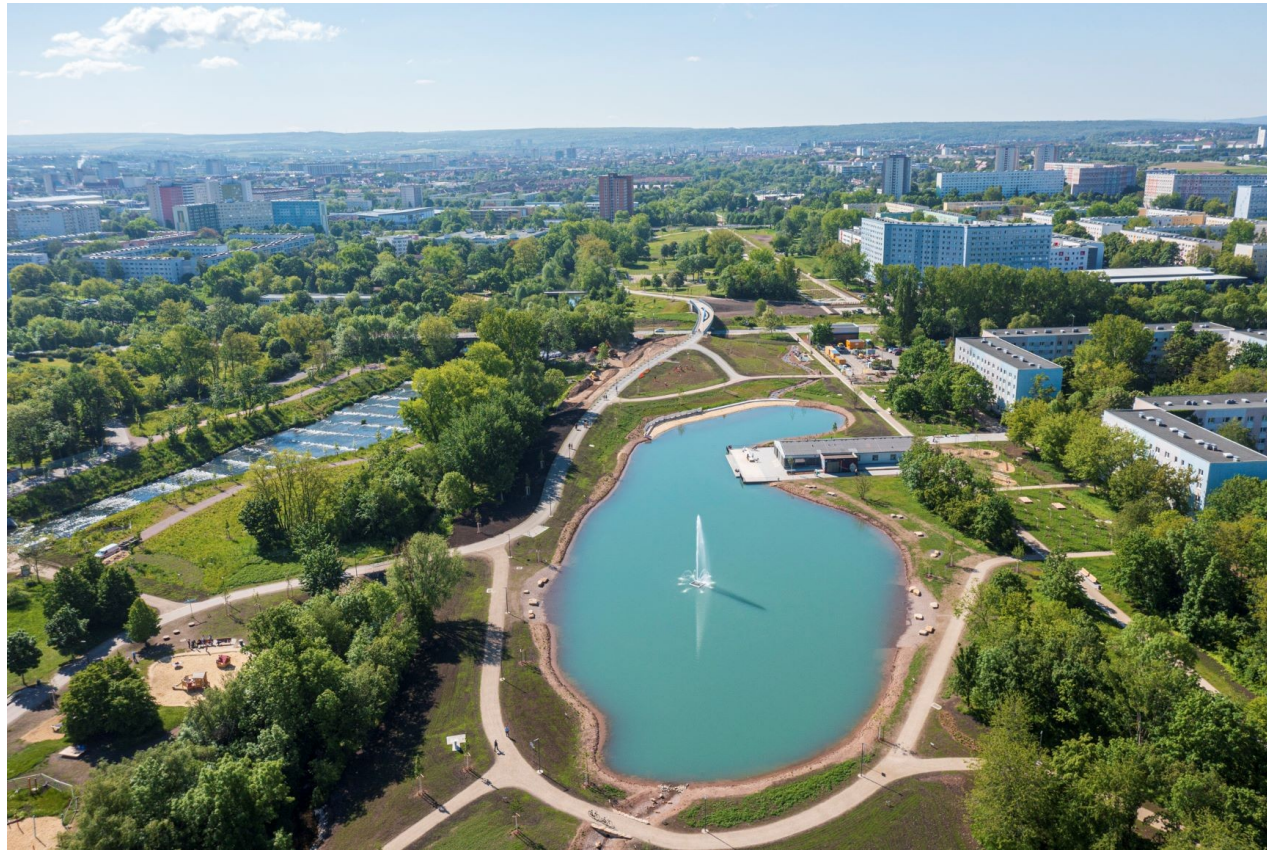
Nördliche Geraaue Aunteich Mai 2021