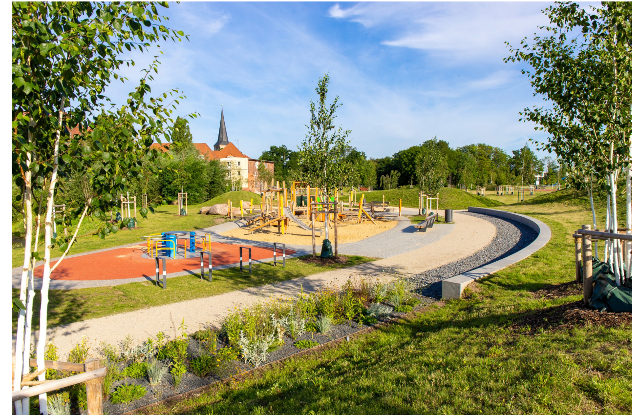
Nördliche Geraaue - Inklusionsspielplatz