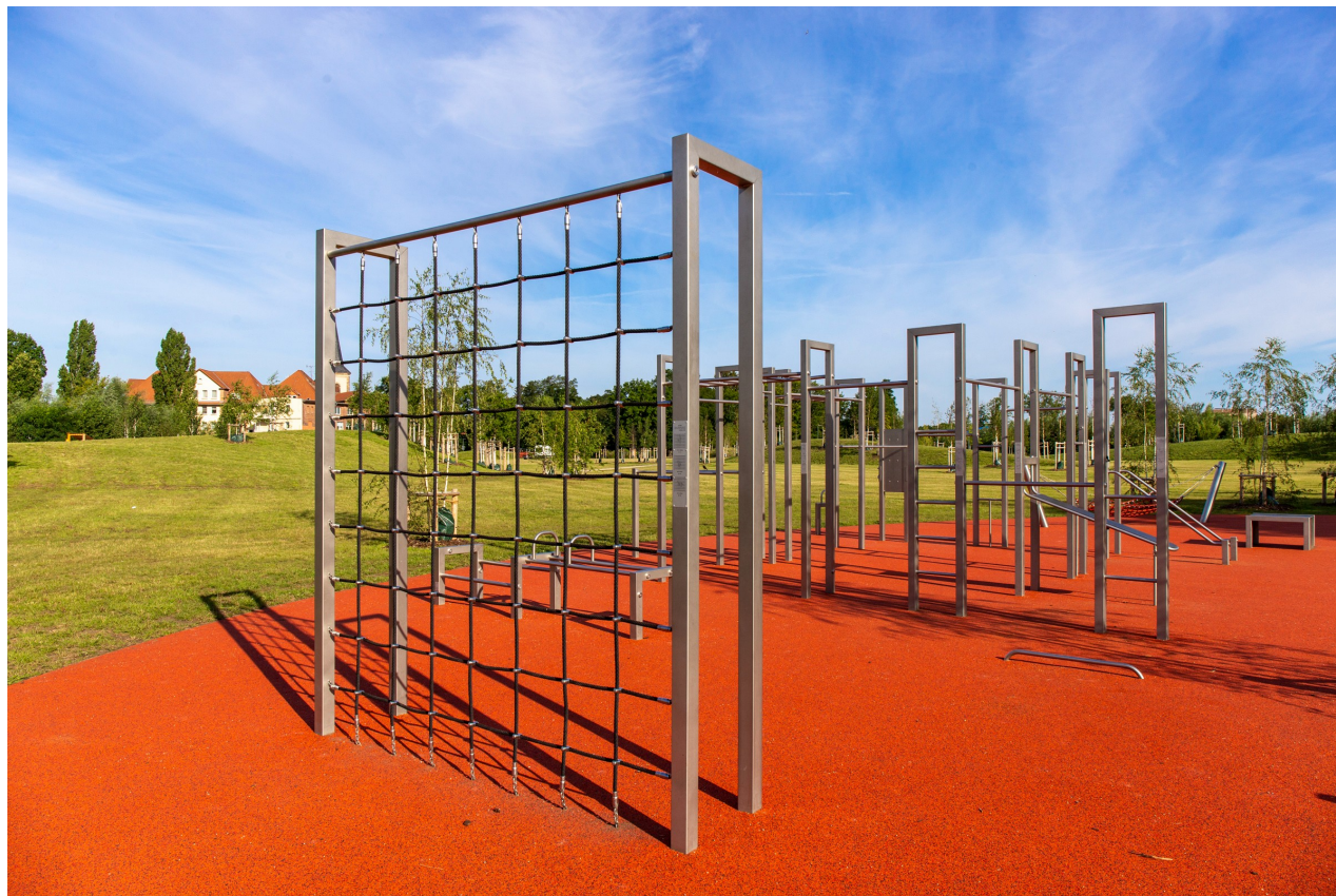
Nördliche Geraaue - Fitnessanlage für Calisthenics