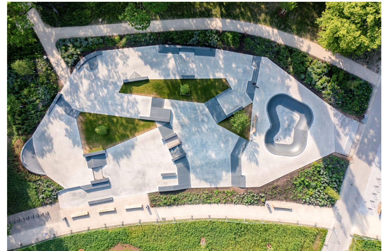
Nördliche Geraaue - Skateanlage Nordpark